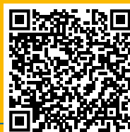
© Riviera Artist Polygone - © by SYLVIE