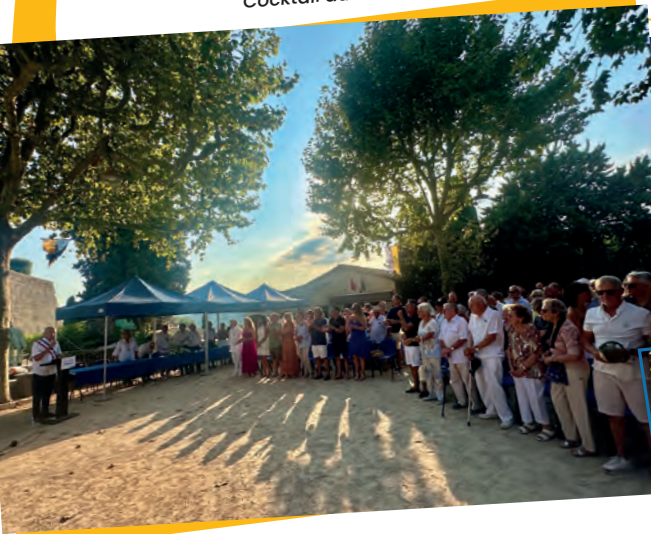
Cocktail du maire