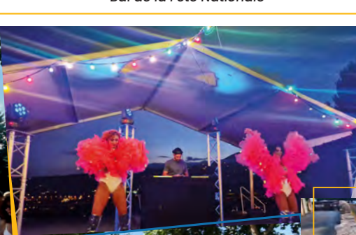
Bal de la Fête Nationale