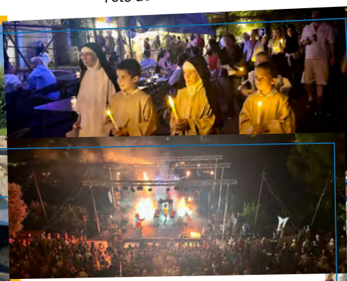
Concert de Synapson