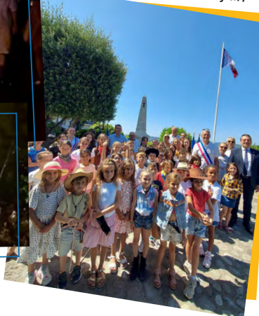
Commémoration du 18 juin