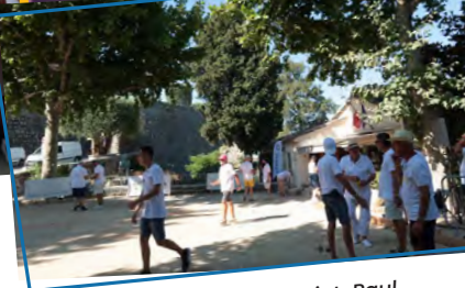
Les Trophées de Saint-Paul