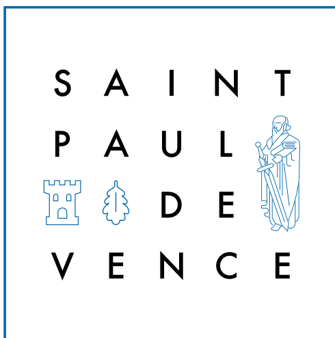
Le nouveau logo de Saint-Paul-de-Vence, représentatif du positionnement actuel de la ville et complémentaire au blason.

V.R. : Lors de nos premiers échanges, il est tout de suite apparu que l'image de la mairie était assez confuse. C'est pourquoi le travail a débuté avec la nouvelle identité graphique. Mais ce n'est pas le seul chantier