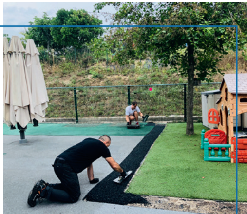
Crèche Le Mas des Ptits Loups

Sécurité, confort ou agrandissement , votre commune ne cesse d'investir dans ses infrastructures. Objectif : accroître votre qualité de vie . Le point sur les travaux terminés cet été, en cours ou à venir à l'automne.