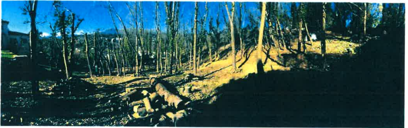
Vue vers Nord