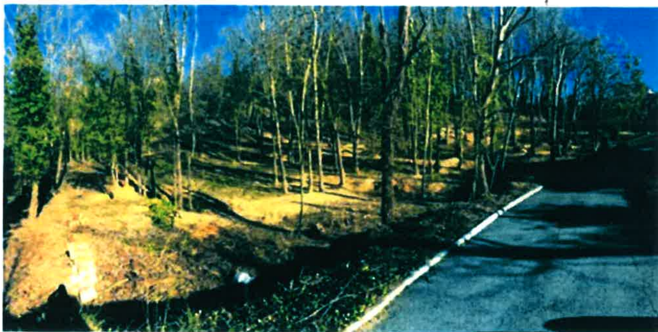
Terrain vue de notre acces existante (Sud vers Nord)