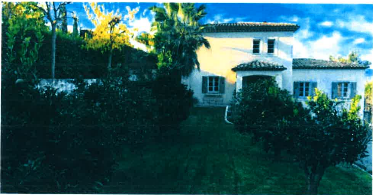
Notre maison existante - nous voudrez que notre future maison serait dans le meme style.