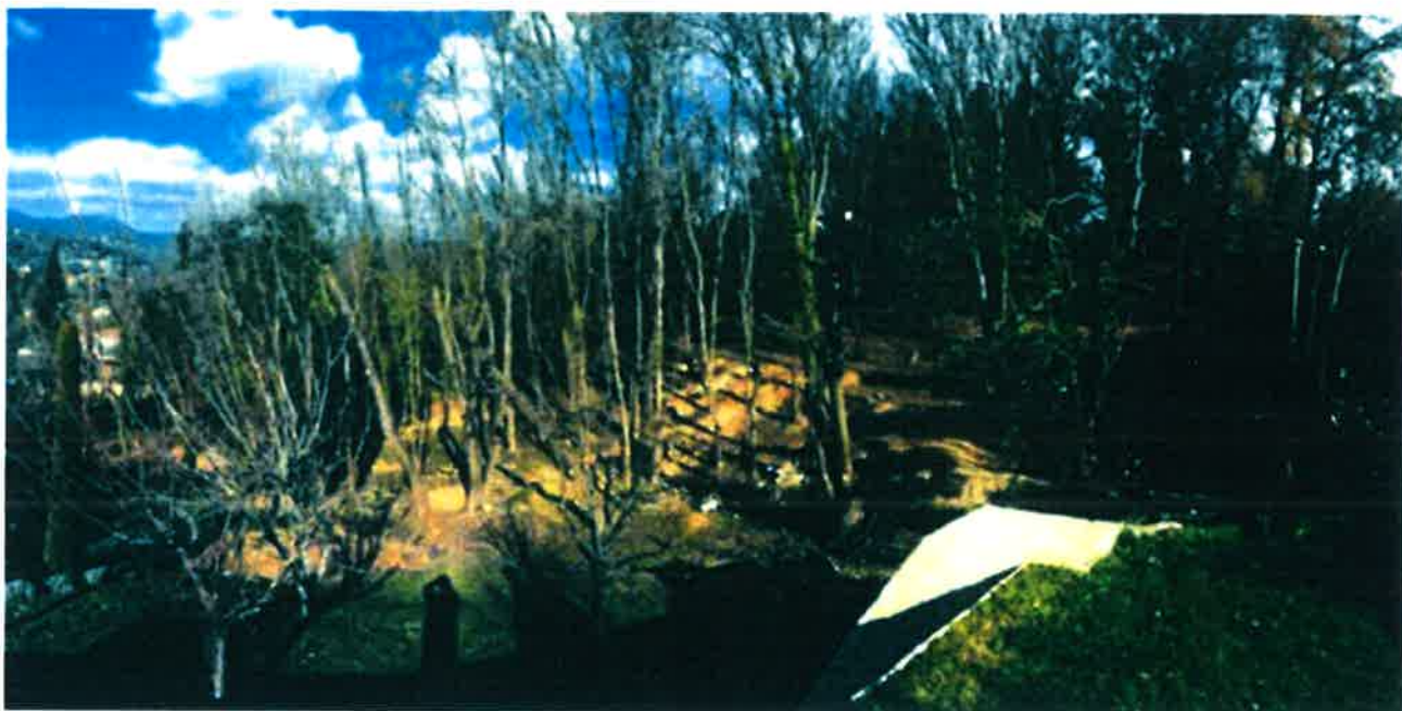
Terrain vue de notre maison (Ouest vers Sud)