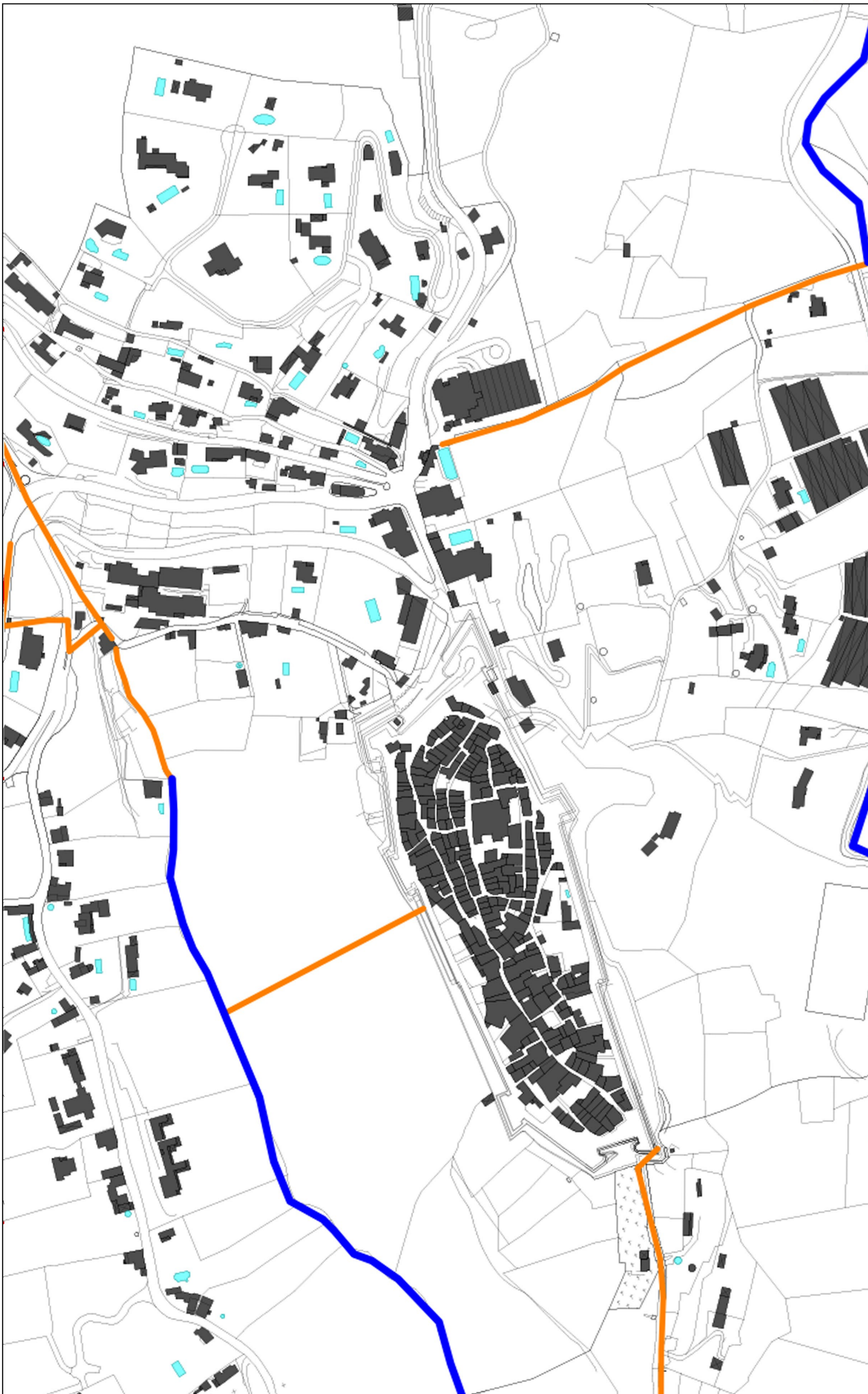
◀ Zoom centre ville - 1/2000ème